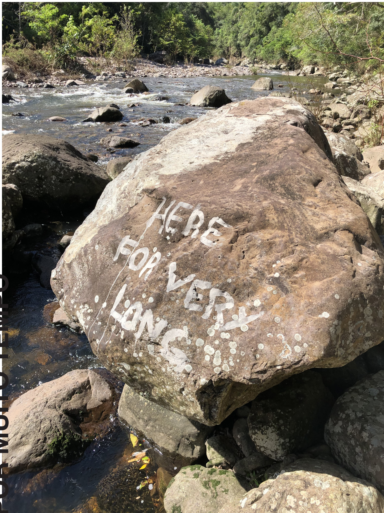
cinzas de madeira com água sobre mineral 2023

HERE FOR VERY LONG Wood ash & water over mineral 2023