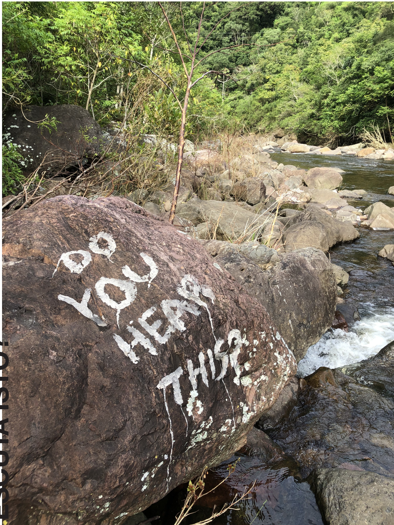
cinzas de madeira com água sobre mineral 2023

DO YOU HEAR THIS? Wood ash & water over mineral 2023