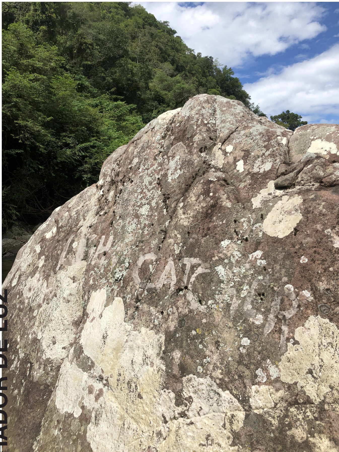
cinzas de madeira com água sobre mineral 2023

LIGHT CATCHER Wood ash & water over mineral 2023