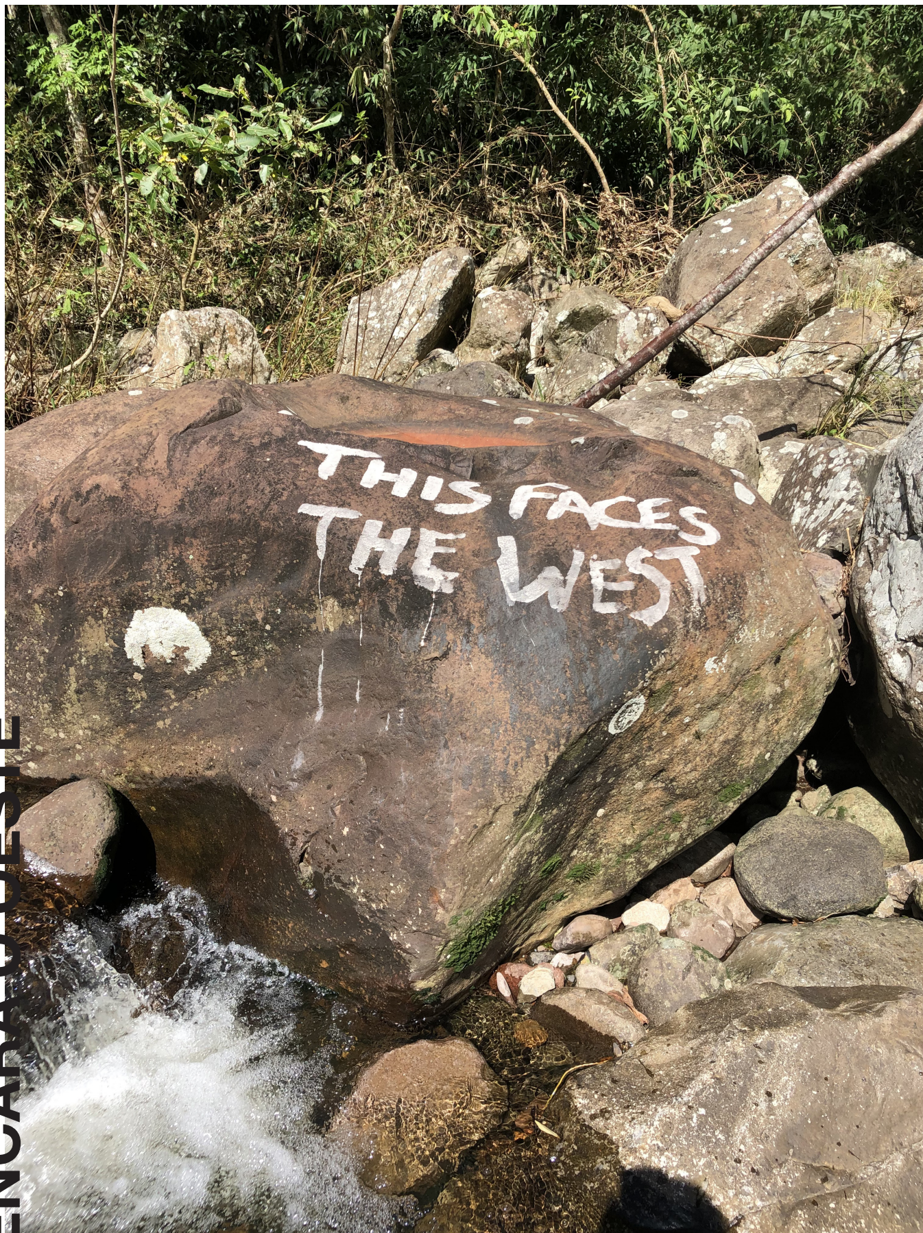
cinzas de madeira com água sobre mineral 2023

THIS FACES THE WEST Wood ash & water over mineral 2023